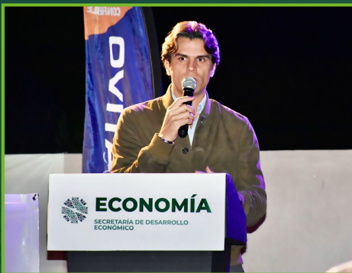
Las y los jóvenes empresarios compartieron con autoridades estatales del ámbito económico, entre ellas, el Secretario de Desarrollo Económico de San Luis Potosí, Juan Carlos Valladares Eichelmann.