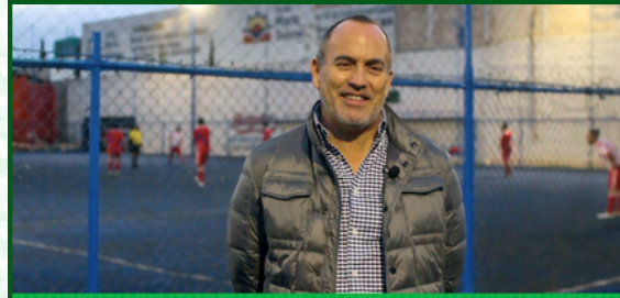
GUILLERMO LIMÓN ROMERO SOCCER CENTER